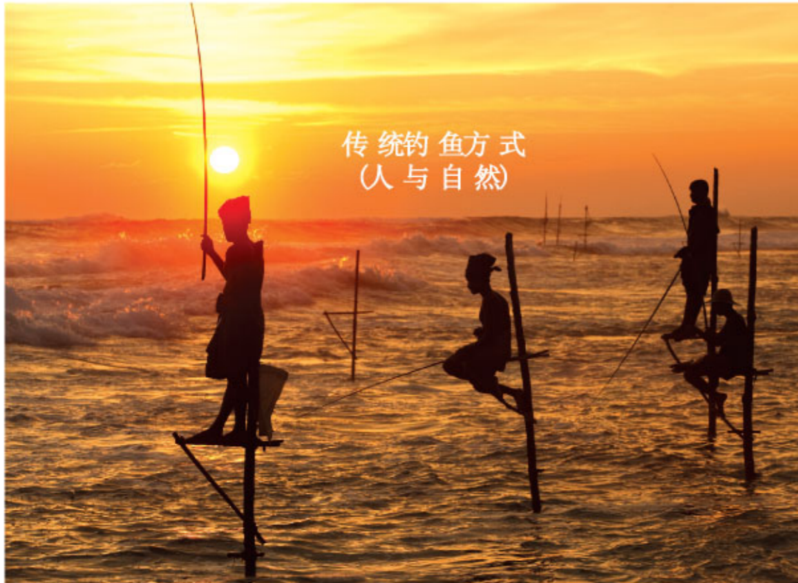
传统钓鱼方式 (人与自然)